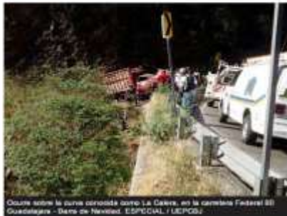
Quiere sobre la curva conocida como La Calera, en la carretera Federal 80, en la demarcación municipal de Casimiro Castillo.

Seguridad | Accidentes con muertos en Jalisco | Accidentes | Protección Civil Jalisco | Autlán